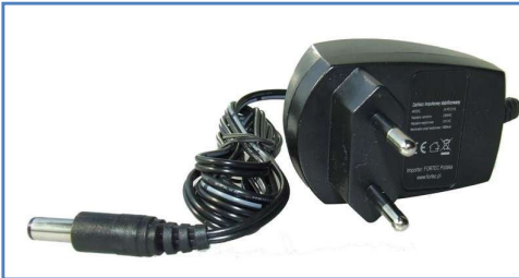
Zasilacz impulsowy 12V 1A kostkowy 50 zł netto

W zależności od potrzeby istnieje możliwość zastosowania różnych zasilaczy 12V.