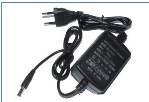
Zasilacz impulsowy 12V 1A z wtyczką 70 zł netto