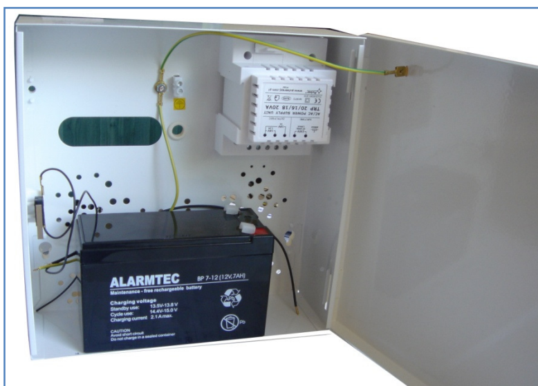
Zasilacz buforowy liniowy 12V z podtrzymaniem UPS 7Ah